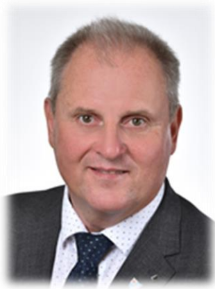
Erwin Häusler Bürgermeister, ÖVP